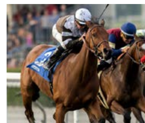
MADAME STRIPES MEGAHERTZ STAKES (USA-3)