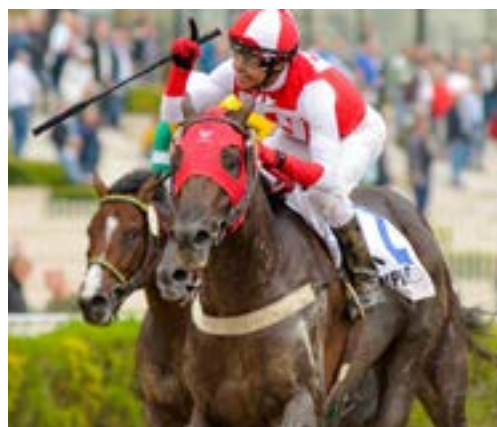
BALOMPIE GP DE HONOR (G1)