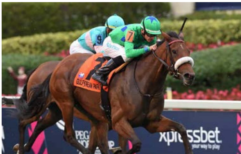
SI QUE ES BUENA LA PROVOYANTE STAKES (USA-3)