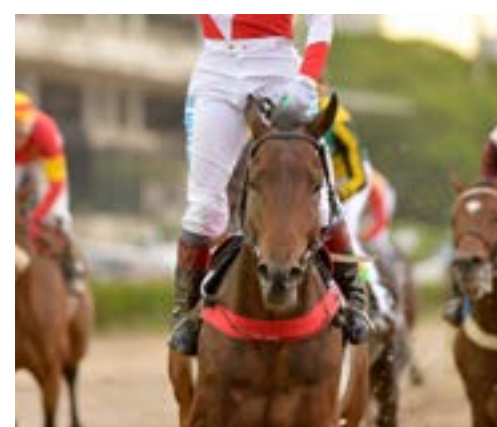
FOR THE TOP GRAN PREMIO NACIONAL (G1)